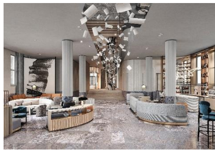
墨爾本逸蘭議會花園酒店 – 大堂

逸蘭明年會繼續其擴展計劃，將在澳洲墨爾本推出全新豪華酒店及服務式公寓項目 墨爾本逸蘭議會花園酒店 ，體現品牌致力締造「個人化酒店及公寓」的承諾，在世界各地的黃金地段呈獻超卓住宿服務。新酒店將座落於墨爾本中心商務區，俯瞰議會花園，地段優越，擁有 137 間各式客房，包括酒店客房以及一房和兩房公寓。