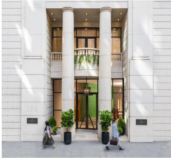
香港逸蘭銅鑼灣酒店

香港，2023年9月21日 – 高端酒店及服務式公寓領域先驅 逸蘭酒店及公寓管理有限公司（逸蘭） 欣然宣佈業務擴展大計及即將登場的項目，力求進一步鞏固其作為個人化酒店及公寓品牌的地位。